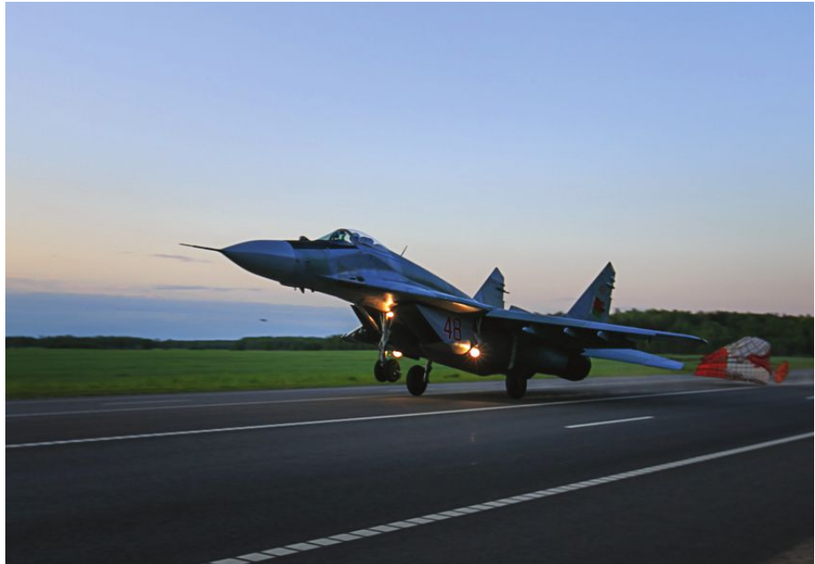
Взлет белорусского самолета МиГ-29 на трассе М4 18 мая 2016 г.

противостояние 9 10 . До сих пор официальный Минск успешно блокирует появление авиабазы 11 , о чем свидетельствует исчезновение заявлений российских официальных представителей о создании дополнительного военного объекта в Беларуси или финансовые инвестиции Минска в свою военную авиацию. Похоже, что сегодня этот вопрос уже неактуален. При том, что в случае необходимости Россия может разместить базу на своей территории в Калининграде с меньшими затратами.