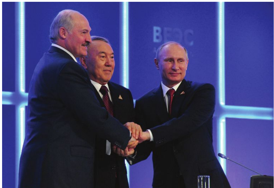
Руководители Беларуси, Казахстана и России во время подписания Договора о создании Евразийского экономического союза 29 мая 2014 г.

Структура белорусского производства исторически была ориентирована на российский рынок, поэтому возникновение кризисных явлений в российской экономике и изменение цен на энергоносители на всемирном рынке неизбежно приводят к ухудшению торгового баланса Беларуси. Во многом экономический закат России обусловил то, что первый год существования Евразийского экономического союза стал для Беларуси неудачным.