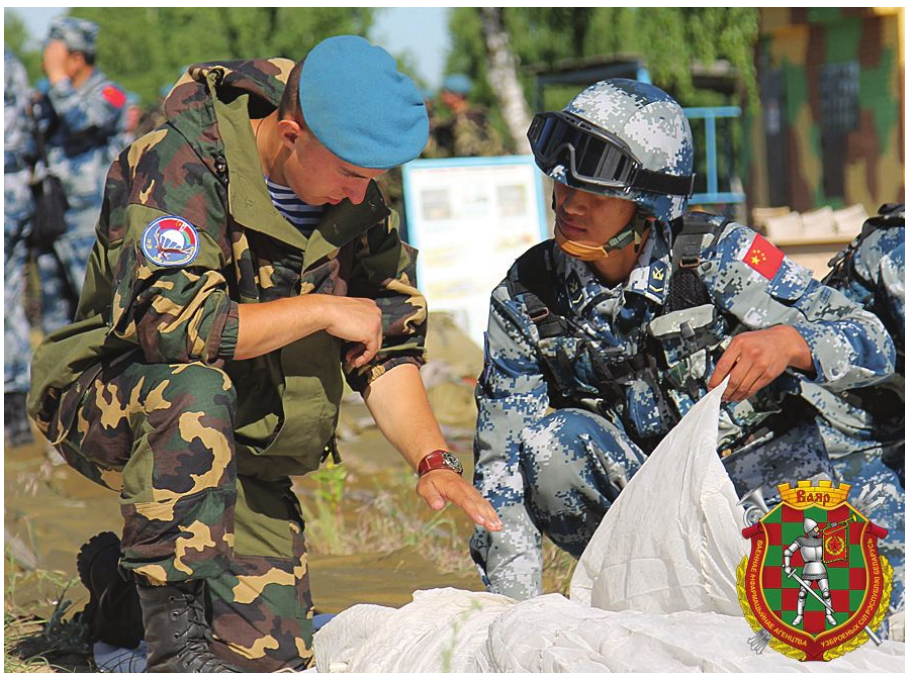
Белорусско-китайские военные учения в июне 2015 г.

В совместных учениях «Щит союза» в 2015 году участвовало в полтора раза меньше военных, чем в «Щите союза – 2011» или «Западе-2013» (~8 тысяч военных против ~12 тысяч). При том, что ранее учения без России выглядели чуть ли не невозможными, а сегодня белорусские десантники ежегодно практикуются вместе с китайскими военными. Хоть и размах этих учений выглядит мизерным в сравнении с учениями с Россией, он показывает желание Беларуси найти новых партнеров. Таким образом, сегодня, по мнению аналитика Андрея Поротникова, уровень военной зависимости Беларуси от России даже меньше, чем, например, уровень военной зависимости Великобритании от Соединенных Штатов 15 .