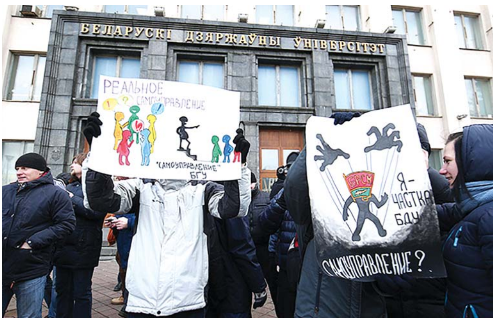
Студэнты Беларускага дзяржаўнага ўніверсітэта пратэстуюць супраць імітацыі самакіравання

У дадзены момант студэнцкае самакіраванне (ССК) існуе ў кожнай вышэйшай навучальнай установе Беларусі, аднак і дакументальна замацаваныя прынцыпы яго функцыянавання, і дзейнасць органаў ССК супярэчаць фундаментальным прынцыпам ЕПВА. У прыватнасці,