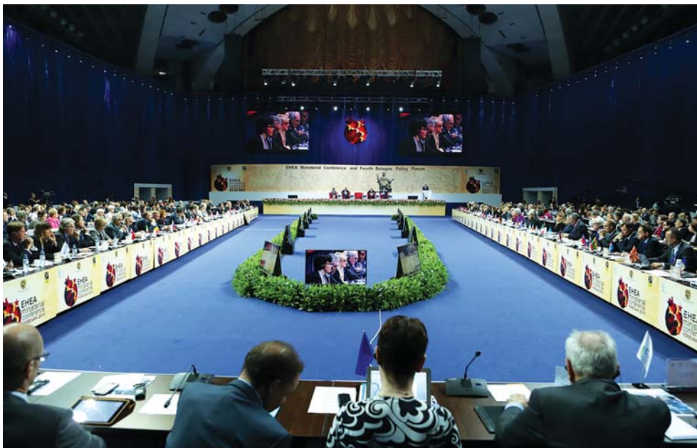
Канферэнцыя міністраў адукацыі ЕПВА і Чацвёрты Балонскі форум 14-15 мая 2015 года, Ерэван, Арменія

Для Беларусі ў шэрагу адзначаных ефектаў далучэння да ЕПВА асабліва істотнай з'яўляецца інтэрнацыяналізацыя вышэйшай адукацыі. Краіна доўгі час знаходзілася ў ізаляцыі ад сусветных адукацыйных працэсаў, у першую чаргу з-за палітычнай напружанасці ў стасунках з Захадам, таму надзвычай важную ролю мае павышэнне мабільнасці студэнтаў і выкладчыкаў, а таксама перайманне лепшых практык арганізацыі акадэмічнага жыцця. Істотнай праблемай з'яўляецца неадэкватнасць сістэмы адукацыі патрэбам рынку працы і захаванне прымусовага размеркавання ў новых эканамічных рэаліях. Цэнтралізаванае кіраванне адукацыяй, якое шмат у чым захавалася з савецкіх часоў, патрабуе ўвядзення прынцыпаў акадэмічнай і інстытуцыйнай аўтаноміі.